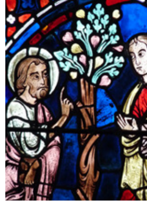
Christus und Nathanael

Aus dem Wahrnehmen und Erleben von Architektur, Bildern, Natur und Licht in unmittelbarem Bezug zum Betrachter, eingebettet in den aktuellen