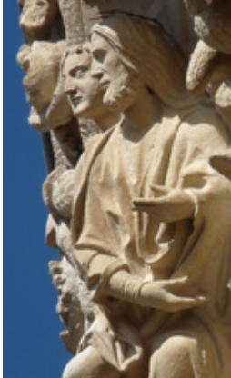
Nordportal, der Mensch im Gedanken Gottes