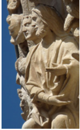
Nordportal, der Mensch im Gedanken Gottes